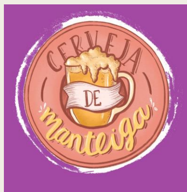
Fundo com cor

A marca deverá ser sempre utilizada em positivo ou em versão monocromática. Relativamente ao fundo, nunca deverá estar sobre um fundo cor de rosa; de maneira a manter a identidade cromática da marca (de preferência, tem de haver o maior contraste possível); a versão monocromática não deve ser colocada sobre um fundo de cor .